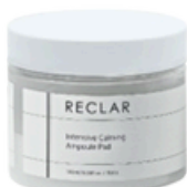
Intensive Calming Ampoule Pad 180ml / 6.08fl.oz. / 70pcs