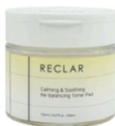
Re-balancing Toner Pad 150ml / 5.07fl.oz. / 60pcs