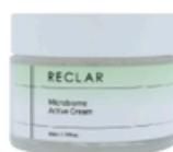
Active Cream 50ml / 1.76fl.oz.