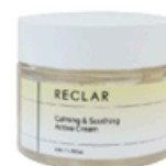
Active Cream 50ml / 1.76fl.oz.