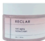
Active Cream 50ml / 1.76fl.oz.