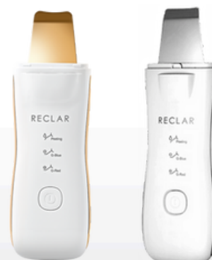
Ritual Peeler Plus 24K GOLD

Mistrzowskie dzieło Reclar, Ritual Peeler, uznawane jest za rewolucyjny produkt w dziedzinie urządzeń kosmetycznych. Dzięki swoim głównym funkcjom peelingu i zabiegu galwanicznego pomaga przywrócić skórze jej naturalny, zdrowy i promienny wygląd, jednocześnie korzystając z podstawowych produktów do pielęgnacji skóry.